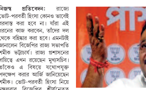
নিরাপত্তা নিশ্চিত করতে বলেছেন তিনি।

সূত্রের খবর, ভোট-পরবর্তী হিংসা নিয়ে মঙ্গলবার বিধাননগরের দপ্তরে যে বৈঠক হয়েছে, সেখানে বিজেপির কেন্দ্রীয় পর্যবেক্ষকেরাও ছিলেন। হিংসা কী ভাবে আটকানো যায়, দলের কী করা উচিত, ২০২১ সালের বিধানসভা নির্বাচনের পর তৃণমূলের বিরুদ্ধে যে ধরনের হিংসার অভিযোগ উঠেছিল, বিজেপির হাতে তার পুনরাবৃত্তি যাতে না হয়, তা নিয়ে আলোচনা হয়েছে। সব স্তরেই হিংসার বিরুদ্ধে বার্তা পাঠানো হয়েছে। রাজনীতির রং না দেখে হিংসার বিরুদ্ধে কঠোর পদক্ষেপের আর্জি প্রশাসনের কাছে রেখেছেন শমীক। সকল রাজ্যবাসীর