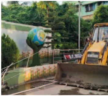
শ্যামনগর ভারতচন্দ্র রায় পথে গড়ে তোলা পার্কে চলল বুলডোজার

২ শ্যামনগর ভারতচন্দ্র রায় পথে গড়ে তোলা পার্কে চলল বুলডোজার